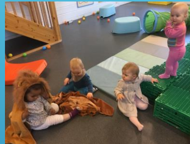
Hinderløype på småbarnsavdelinga.